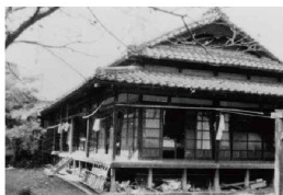
日本赤十字社熊本支部 診療所開設 (37床)