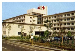
長嶺町移転 (300床~) ※旧健軍空港跡地