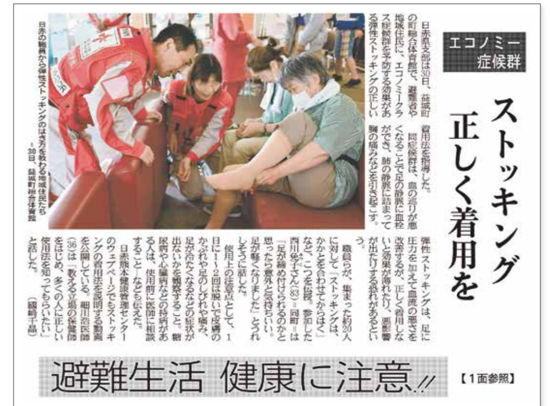
2016年5月1日付 熊本日日新聞朝刊